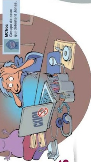
McFroc Groupe de ceux qui détestent Jonas.